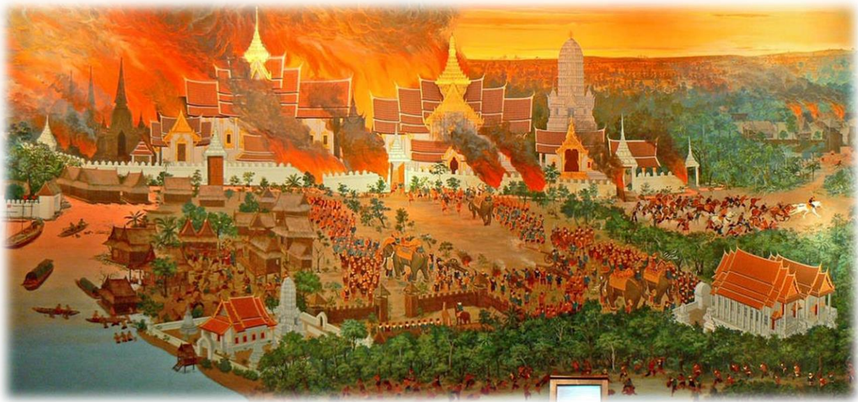
ภาพที่ 1.8 สงครามครั้งสุดท้ายในสมัยอยุธยาในปี พ.ศ. 2310