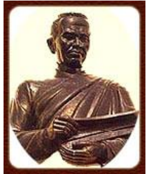
ภาพที่ 1.6 สมเด็จพระบรมไตรโลกนาถ

ในสมัยที่สมเด็จพระนเรศวรมหาราช ครองราชย์สมบัติ เป็นช่วงเวลาที่ยกทัพ อยุธยาที่มีความเข้มแข็ง สามารถทำสงคราม ขยายอาณาเขตออกไปอย่างกว้างขวางและ ปราบปรามเมืองต่าง ๆ ได้อย่างราบคาบ ทำให้ บ้านเมืองมีความมั่นคง สงบเรียบร้อย ซึ่ง ส่งผลดีต่อการพัฒนาประเทศในหลายด้าน