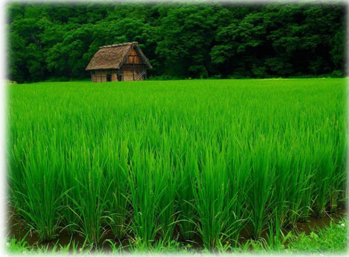
ภาพที่ 1.3 ความอุดมสมบูรณ์ของพื้นที่เป็นหนึ่งในปัจจัยที่เอื้ออำนวย ต่อการสถาปนาอาณาจักรอยุธยา