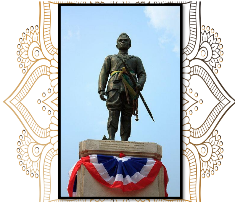
ภาพที่ 1.2 พระบรมราชานุสาวรีย์พระเจ้าอู่ทอง จังหวัดพระนครศรีอยุธยา