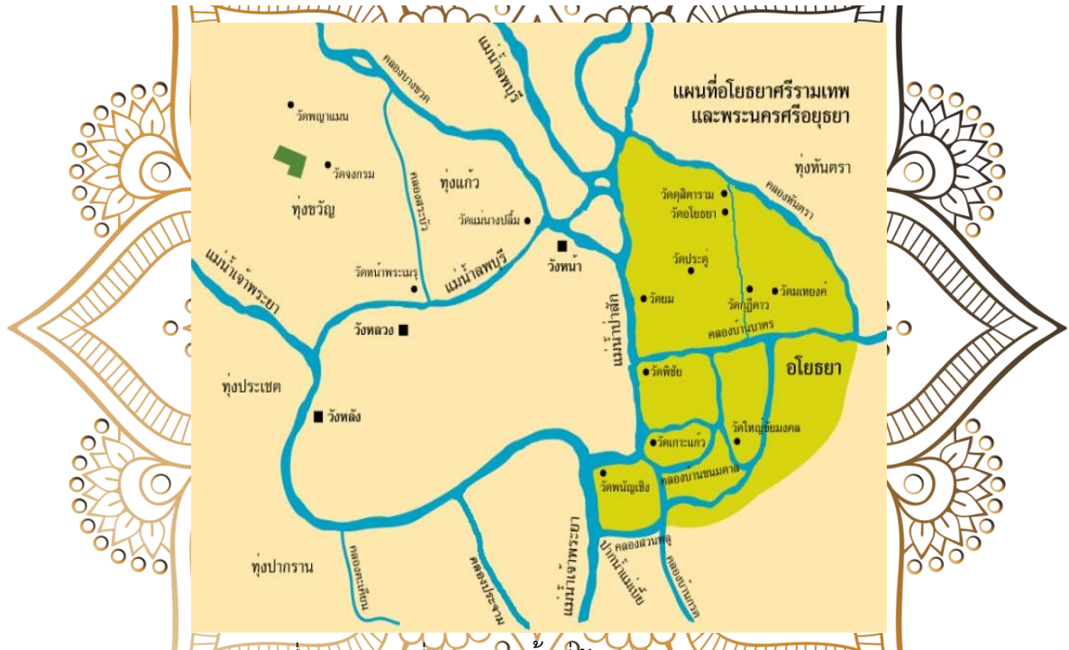
ภาพที่ 1.4 แผนที่แสดงแม่น้ำที่ล้อมรอบอาณาจักรอยุธยา