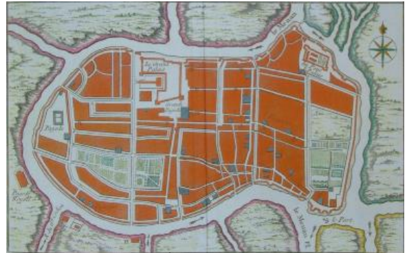
ภาพที่ 1.5 แม่น้ำที่ล้อมรอบอาณาจักรอยุธยาเป็นแนวป้องกันการบุกรุกของข้าศึกได้เป็นอย่างดี

ในสมัยของสมเด็จพระบรมไตรโลกนาถ (พ.ศ. 1991–2031) ซึ่งเป็นกษัตริย์ที่ครองราชย์ยาวนานที่สุดในสมัยอยุธยา พระองค์ทรงทำการปฏิรูปการปกครอง ทรงวางรากฐานระเบียบการบริหารราชการแผ่นดินส่วนกลางและส่วนหัวเมือง และจัดระเบียบสังคมไทย