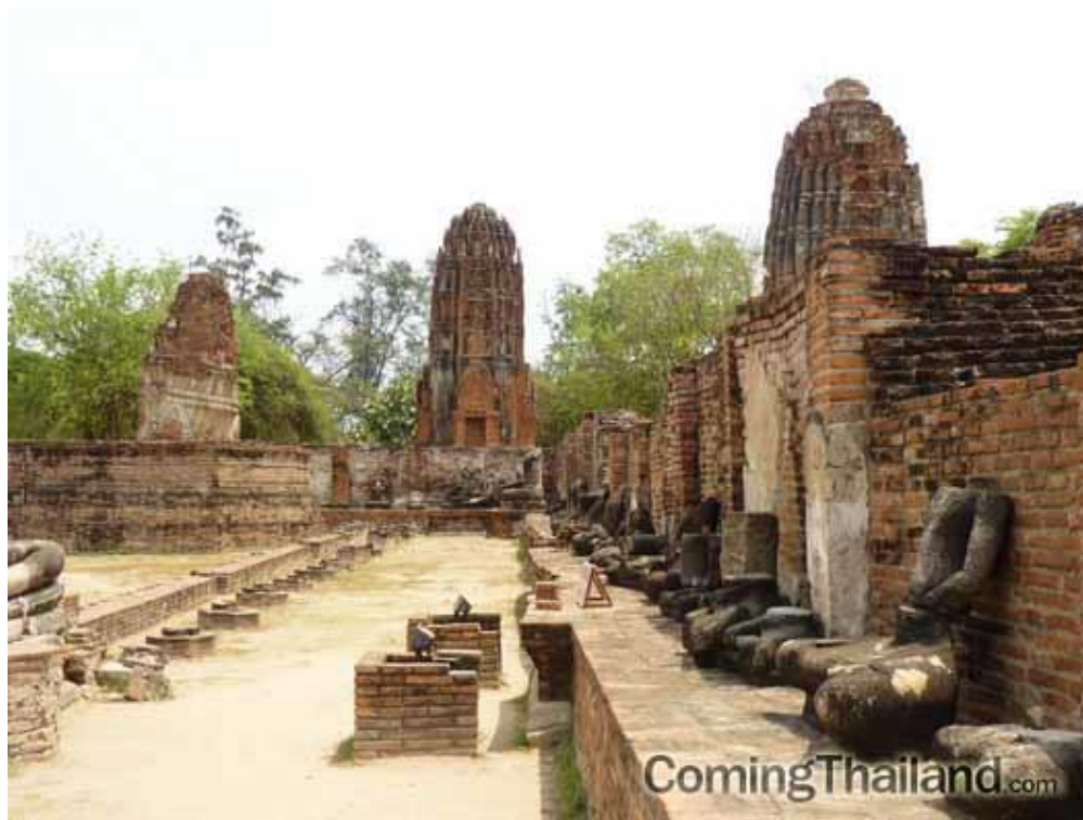
ภาพที่ 1.9 การเสียกรุงศรีอยุธยาครั้งที่ 2 แก่พม่าทำให้ราชธานีได้รับ ความเสียหายยากเกินจะบูรณะขึ้นใหม่ได้